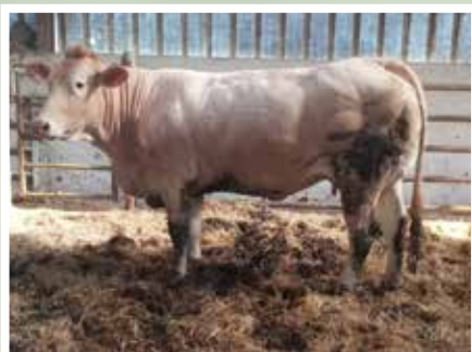
EARL MENDIA OSSES (64)