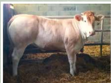
MENDIONDO XAVIER - BUSSUNARITS (64)