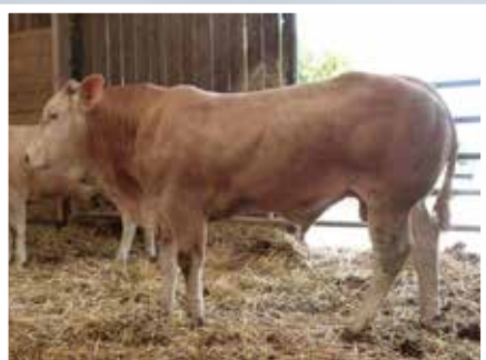
GAEC LE PARPOUNET - CHAVAGNES EN PAILLERS (85)