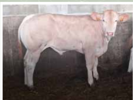
GAEC ARTIKITE AINHICE MONJELOS (64)