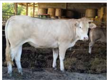
PIERRE ABBADIE - OREGUE (64)