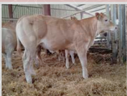
M. CHOHOBIGARAT BENAT - LUXE (64)