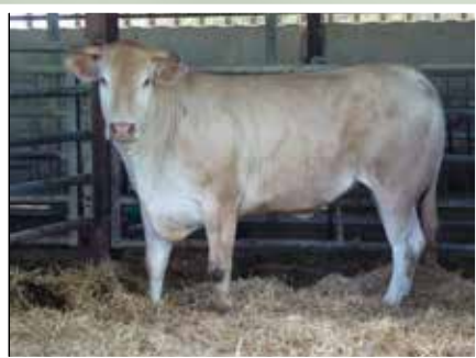
M. CHOHOBIGARAT - LUXE (64)