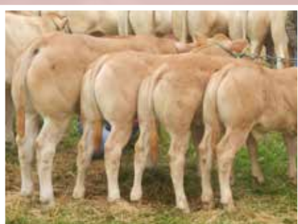
DESCENDANCE DE CONGO