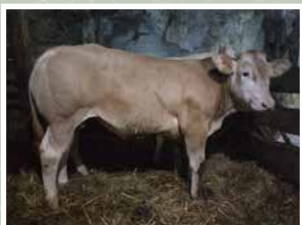
ETCHEMENDY STEPHANE - MENDIVE (64)