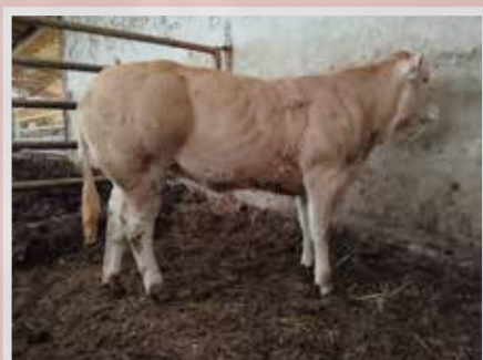
MIURA PEYO - LANTABAT (64)