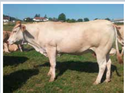
GAEC ITUR XOKO - LARCEVEAU 64)