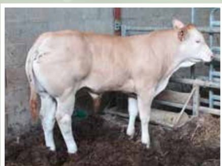
BACHO PEYO - ST JUST IBARRE (64)