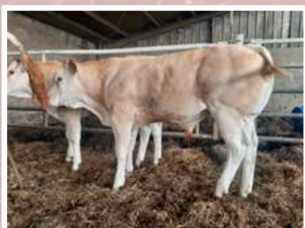
PLANTE JEAN-PIERRE - PORT DE LANNE (64)