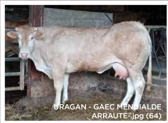
URAGAN - GAEC MENDIALDE ARRAUTE-jpg (64)