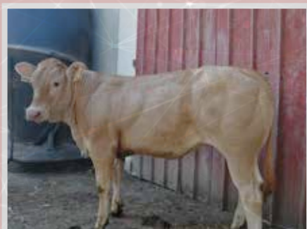
GAEC AGARA - LARRESSORRE (64)