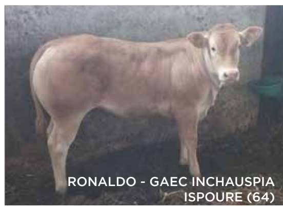
RONALDO - GAEC INCHAUSPIA ISPOURE (64)