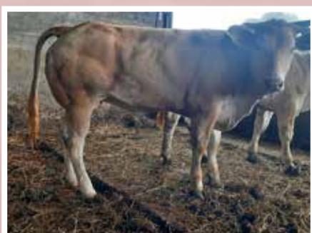
PLANTE JEAN-PIERRE - PORT DE LANNE (64)