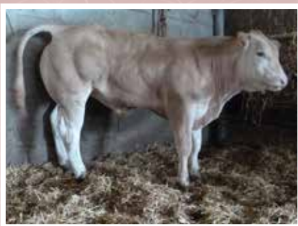
GAEC LARRONDOA - LOHITZUN (64)