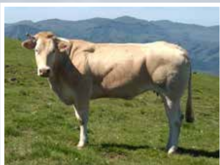
GAEC AINTZINA SEGI - BEHORLEGUY (64)