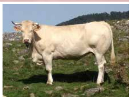
GAEC ERROMATEYA - AHAXE (64)