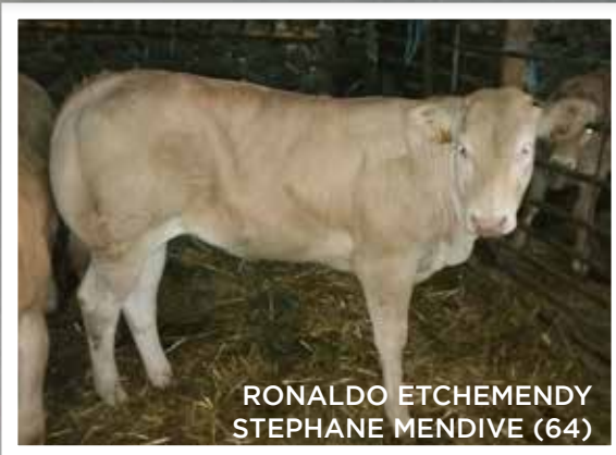
RONALDO ETCHEMENDY STEPHANE MENDIVE (64)