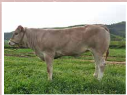
GAEC AMBURIA - PAGOLE (64)