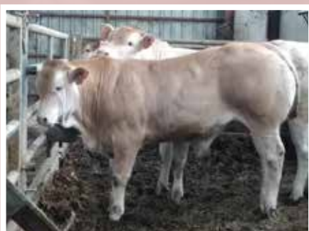
GAEC ENEKORRI - LES ALDUDES (64)