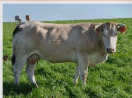
GAEC LE PARPOUNET - CHAVAGNES EN PAILLERS (85)