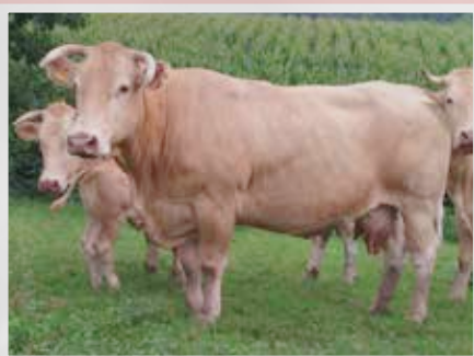
SCEA ECHART - ASCARAT (64)