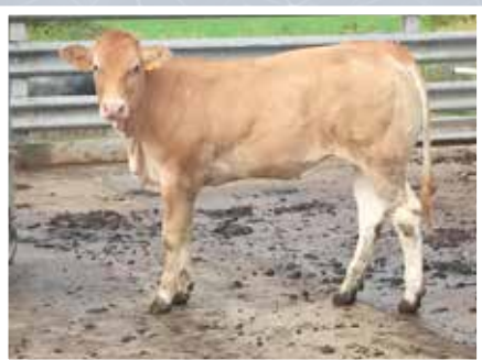
GAEC OIHANARTIA OSTABAT (64)