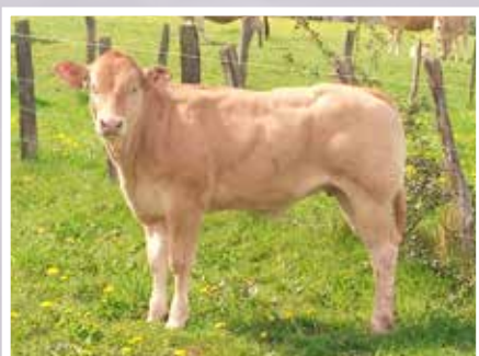
SCEA ETCHART- ASCARAT (64)