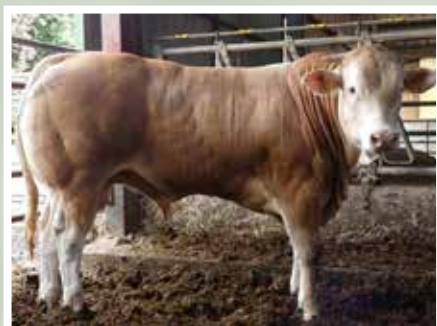
GAEC LE PARPOUNET - CHAVAGNE EN PAILLE 85 - (64)