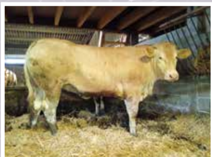
GAEC MENDI ALDE ARRAUTE CHARRITE (64)