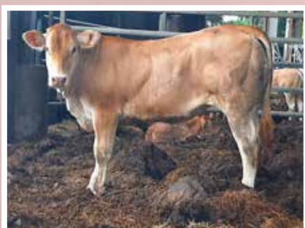
PLANTE JEAN-PIERRE - PORT DE LANNE (64)