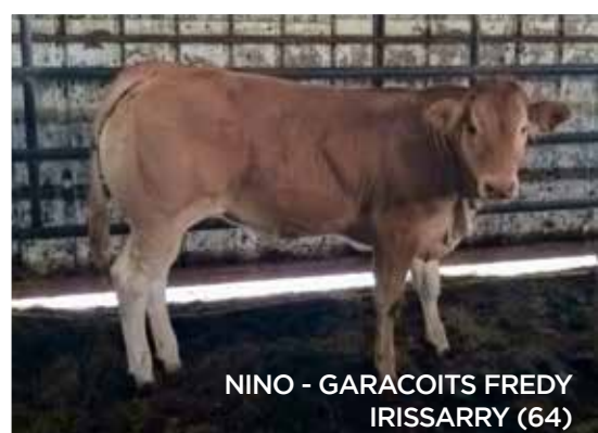
NINO - GARACOITS FREDY IRISSARRY (64)