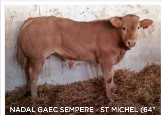
NADAL GAEC SEMPERE - ST MICHEL (64°)