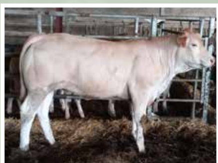
GAEC OIHANALDE - IRISSARRY (64)