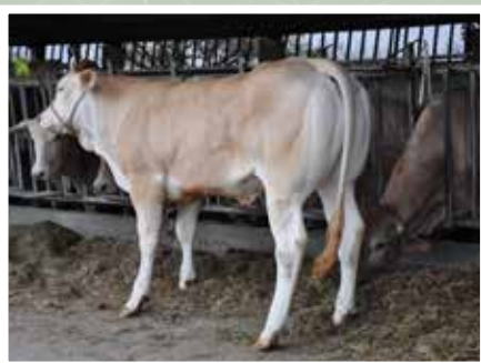
GAEC HEGOALDE - LA BASTIDE CLAIRENCE (64)